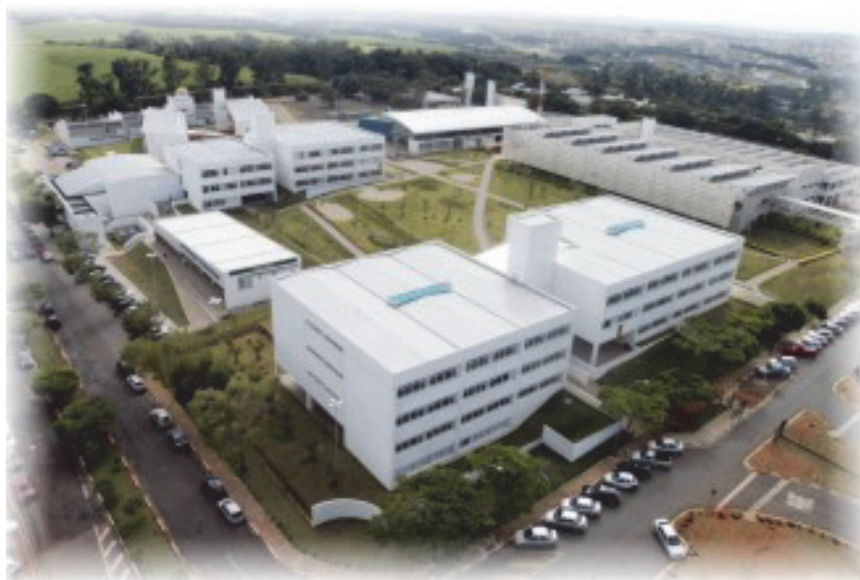
Vista Aérea Parcial Campus I