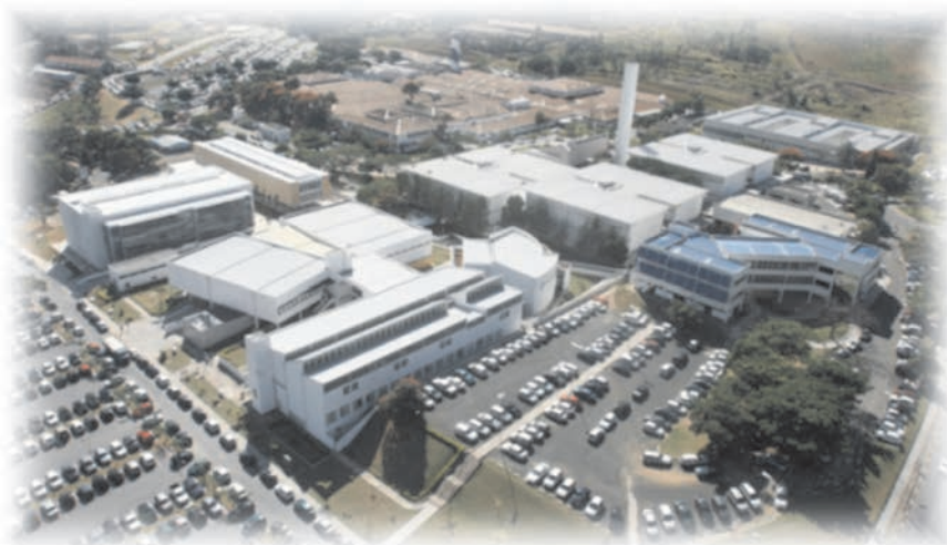
Vista Aérea Parcial Campus II